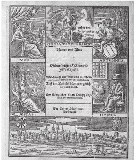
5. L. Eichstadt, Newer und Alter Schreib Calender Auff's Jahr... na 1649 rok. Kompozycja tekstowa z bordiurą ilustracyjną