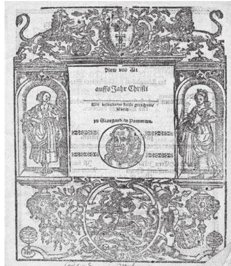
10. D. Herlicius, New Und Alt Schreibcalender auff das Jahr... na 1638 rok. Kompozycja z plakieta ilustracyjną i bordiurą ilustracyjną

czono widok Gdańska 104 . Druga tego typu karta tytułowa znajduje się w kalendarzu Stefana Furmana na 1652 rok 105 . Poniżej głównego tytułu umieszczono przedstawienie dwóch, częściowych zaćmień Księżyca oraz Słońca w formie winiety. Adres drukarski oddzielono ozdobnikiem roślinnym.