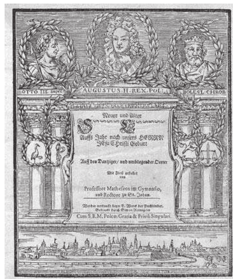
8. F. Büthner, Neuer und Alter Schreib-Calendar Auff's Jahr... na 1699 rok. Kompozycja tekstowa z enklawą tekstową [ze zbiorów Polskiej Akademii Nauk Biblioteki Gdańskiej]

respondowały z czterema personifikacjami pór roku 87 . Wydawca szukał nabywców swoich druków nie tylko w Gdańsku i Królewcu, ale także w Toruniu. W tym roczniku zaprezentował widok tego ostatniego miasta od strony Wisły z toruńskim herbem i polskim orłem (il. 5). Ponownie notka w tytule ogłaszała: Gedruckt zu Dantzig . W następnych rocznikach do bordiury ilustracyjnej dodano plakiety, co zostało omówione poniżej. Niewykluczone, że drukarz z redaktorem sporządzali po kilka edycji, mutacji tego samego kalendarza.