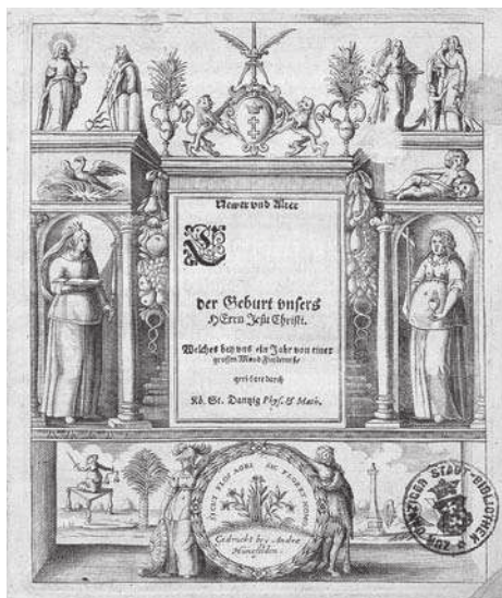
3. L. Eichstadt, Newer und Alter Schreib Calender Auffſ Jahr... na 1646 rok. Kompozycja tekstowa z bordiurą ilustracyjną