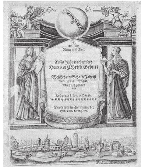
6. F. Büthner, New und Alter Schreib Calender Auff's Jahr... na 1664 rok. Kompozycja tekstowa z enklawą tekstową [ze zbiorów Polskiej Akademii Nauk Biblioteki Gdańskiej]

czesny zespół miejski: koronę pomiędzy dwiema gwiazdami (symbol Lipnika), koronę z białym krzyżem (Stare Miasto) oraz koronę wśród dwóch myśliwskich rogów (Knipawa). Powyższe przedstawienie pozwala wysunąć wniosek, że druk ten był przeznaczony do rozprowadzania w Królewcu i okolicach. Taką samą kartę umieszczono w almanachu Albertusa Linemannusa. Jednakże pozostając w zgodności z zasadą, że zainteresowaniem obejmujemy tytuły powstałe na terenie gdańskich oficyn, pozostaje niniejsze wydawnictwa zaliczyć do gdańskich kalendarzy. Świadczy o tym notka w tytule: Gedruckt zu Dantzig .