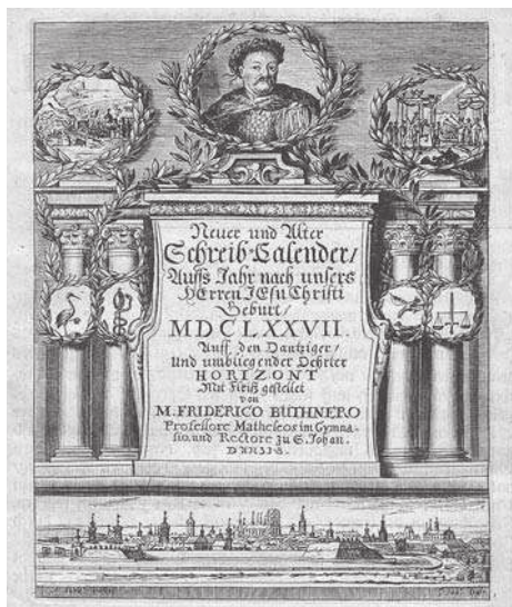
7. F. Büthner, Neuer und Alter Schreib-Calendar Auff's Jahr... na 1677 rok. Kompozycja tekstowa z enklawą tekstową