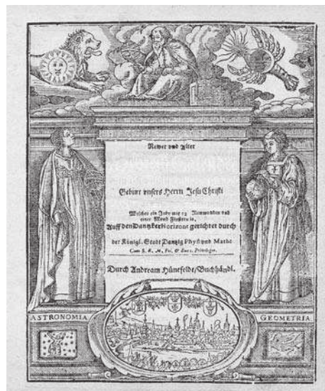
4. L. Eichstadt, Newer und Alter Schreib Calender Auffſ Jahr... na 1648 rok. Kompozycja tekstowa z enklawą tekstową [ze zbiorów Polskiej Akademii Nauk Biblioteki Gdańskiej]

zdarzało się w kalendarzach bardzo rzadko 83 . To przedstawienie ikonograficzne należy zaliczyć do bogatych (il. 3). Pomijając szczegółową interpretację, przedstawię tylko najważniejsze cechy miedziorytu. U góry, nad tytułem, umieszczono herb Gdańska. Na dole widniał emblemat drukarski, w otoku ze słowami: sicut flos agri sic floret homo , co odnosiło się do biblijnego Psalmu 103 84 . Całość skomponowana była w stylu kolumnowym, który charakteryzował liczną grupę druków. Taka sama karta została zaprezentowana czytelnikowi, który sięgnął po gdański kalendarz w 1651, 1652 i 1653 roku. W almanachach na 1647 i 1648 rok wytłoczono odbicie drzeworytowe 85 . W górnej części, zamiast astronomii, pojawił się astronom (il. 4). Otoczony dwoma znakami zodiaku: lwem ze słońcem i rakiem z księżycem. Poniżej wprowadzono novum, góra została wsparta na personifikacjach astronomii i geometrii. Ciekawie prezentuje się dół strony, przedstawiono tam, w otoku widok Królewca. Dowodem na to są trzy herby tworzące ów-